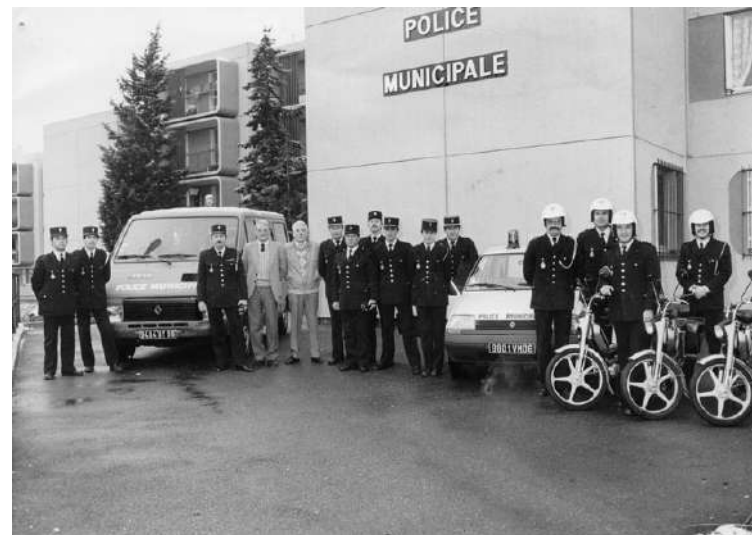
PM de Vallauris, 1984