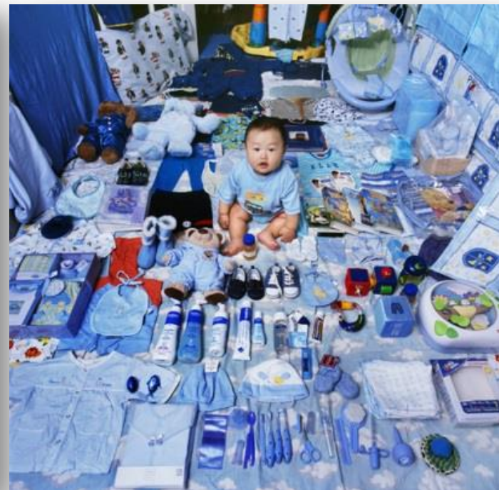
JeongMee Yoon – The pink and blue project